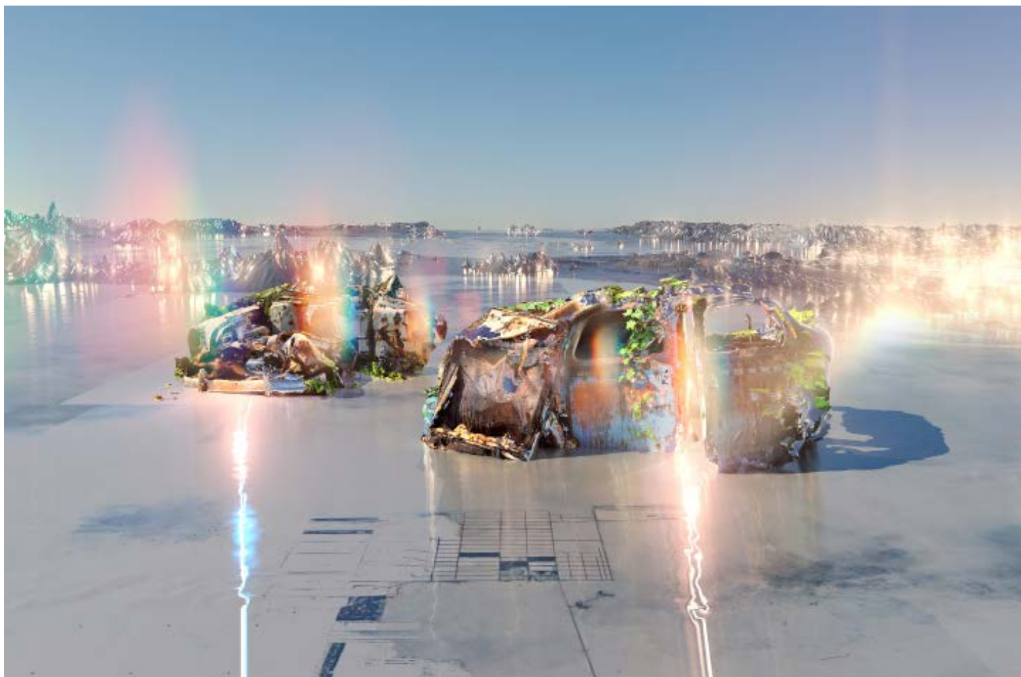
Sabrina Ratté. Print on dibond , Objets-monde , 2022. Print 177 x 118 cm, Ed. 1/5

Production Le FRESNOY - Studio national des arts contemporains (Tourcoing)