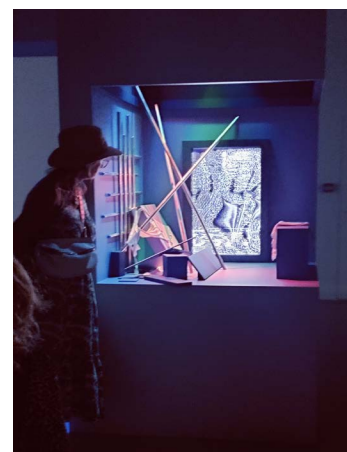
S. Ratté, Installation Gaité Lyrique