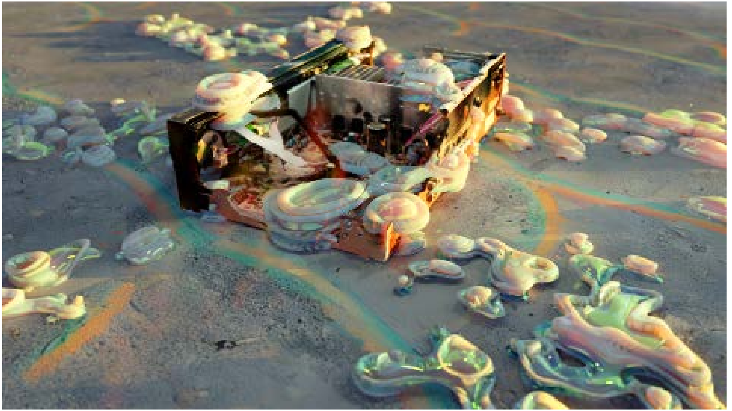
Video S.Ratté, Inflorescences II , 2023, 3'43", Ed. 1/5