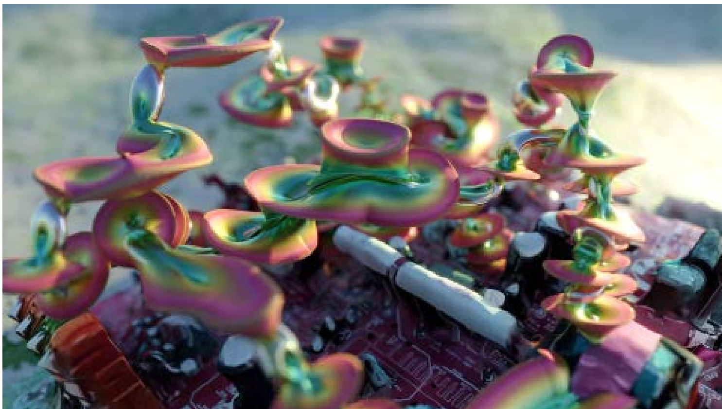
Video S.Ratté, Inflorescences I , 2023, 3'41", Ed. 1/5