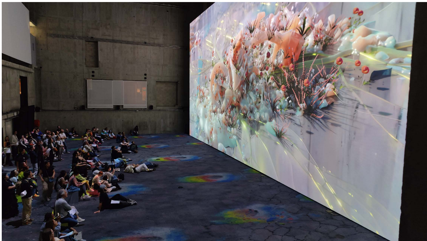
Sabrina Ratté. Plane of incidence II , 2024. Grand Palais Immersif, Opéra Bastille, Paris, 2024

Plane of Incidence explores the notions of the object, the living and speculative evolution, drawing freely on links such as the agentivity of objects, animism and Lynn Margulis's concept of 'Interliving'. This exploration aims to redefine our reality by examining how all forms of existence are interconnected.