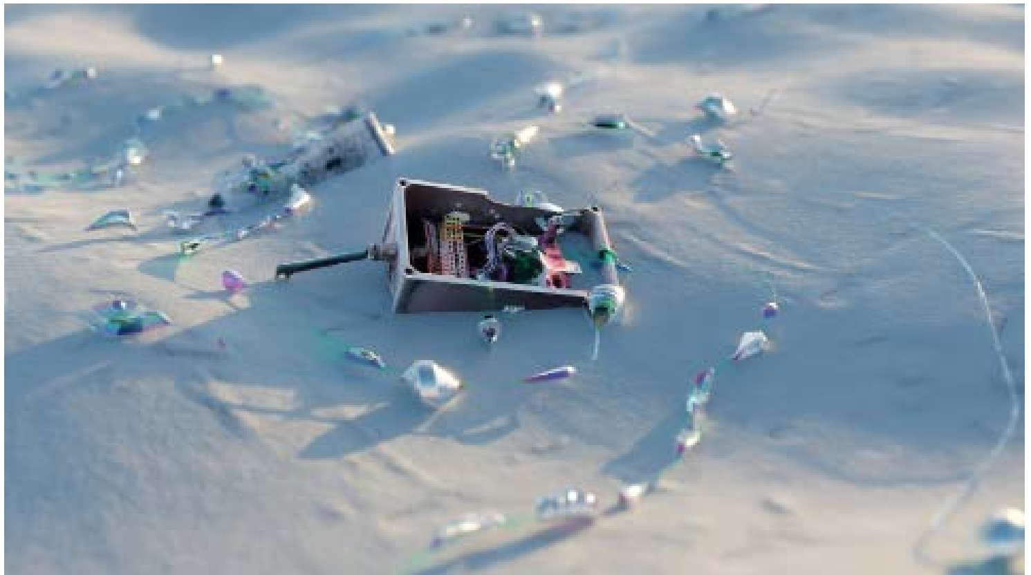
Video S.Ratté, Inflorescences III , 2023, 3'47", Ed. 1/5