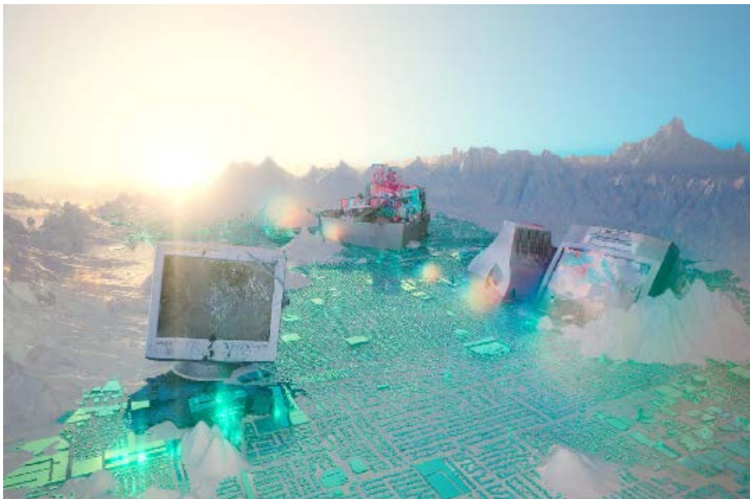
Sabrina Ratté. Objets-monde , 2022. Print 177 x 118 cm, Ed. 1/5