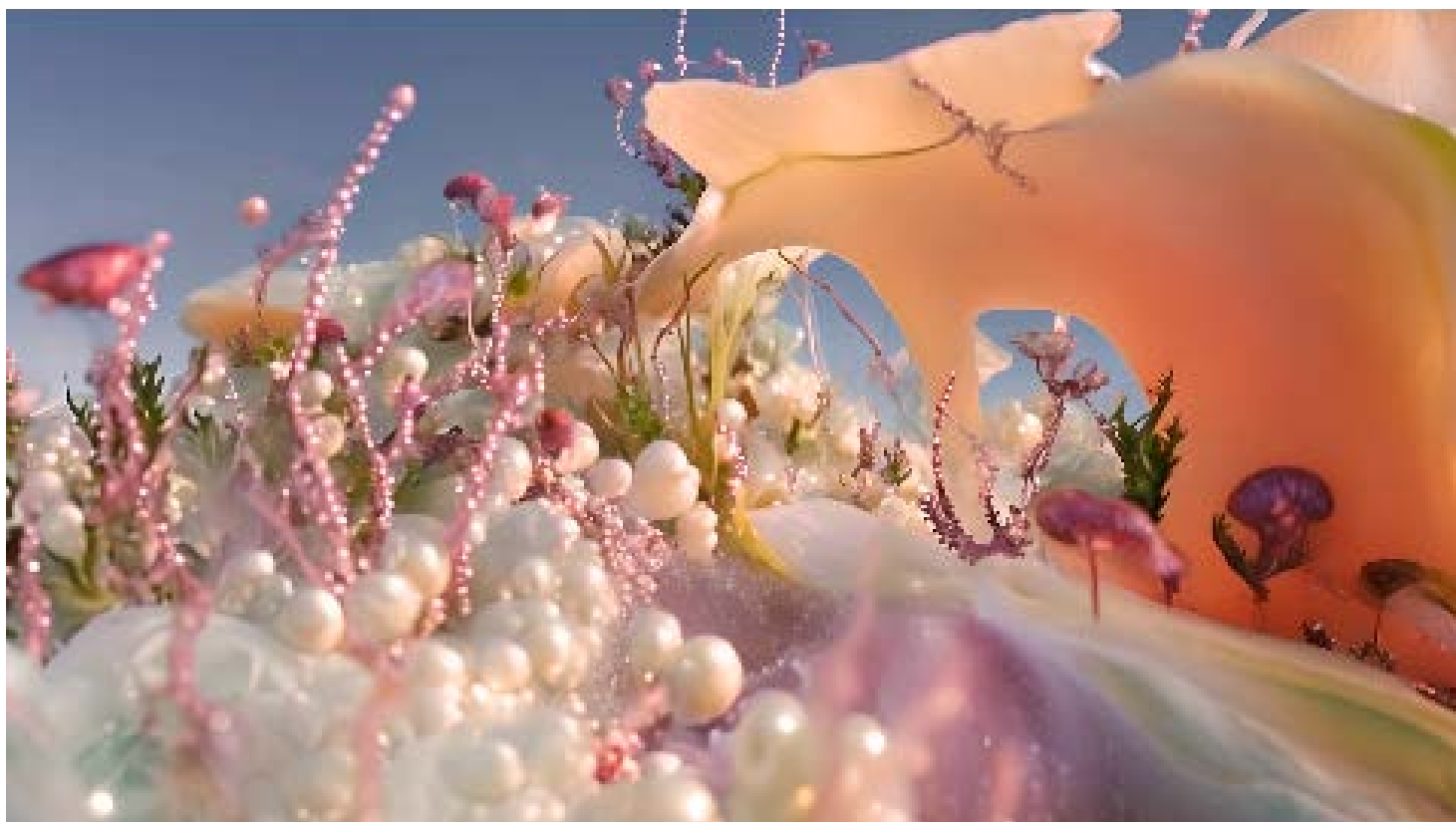
Sabrina Ratté. Plane of incidence I , 2024.