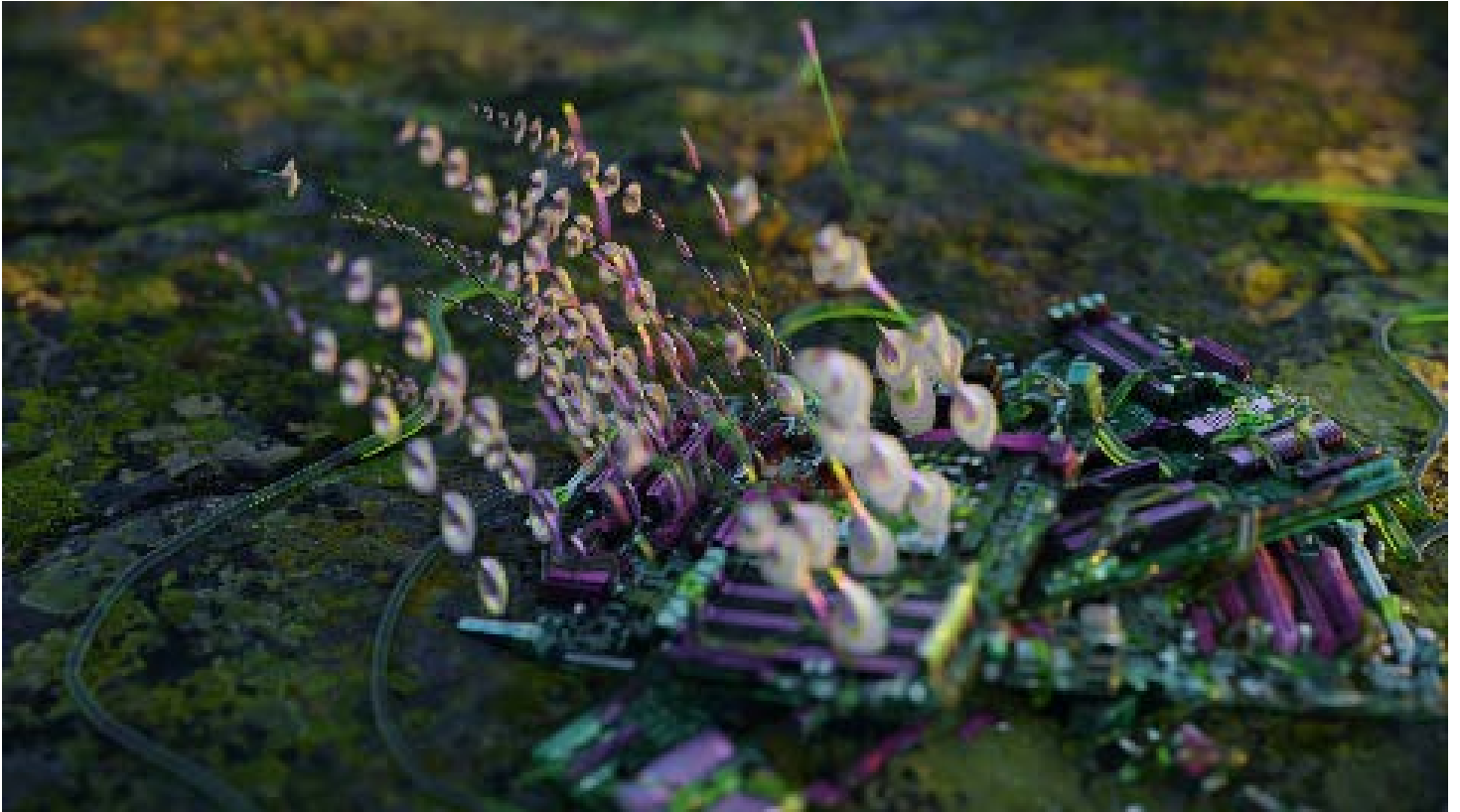
Video S.Ratté, Inflorescences IV , 2023, 3'39", Ed. 1/5

Son : Roger Tellier Craig - Production New Now Festival