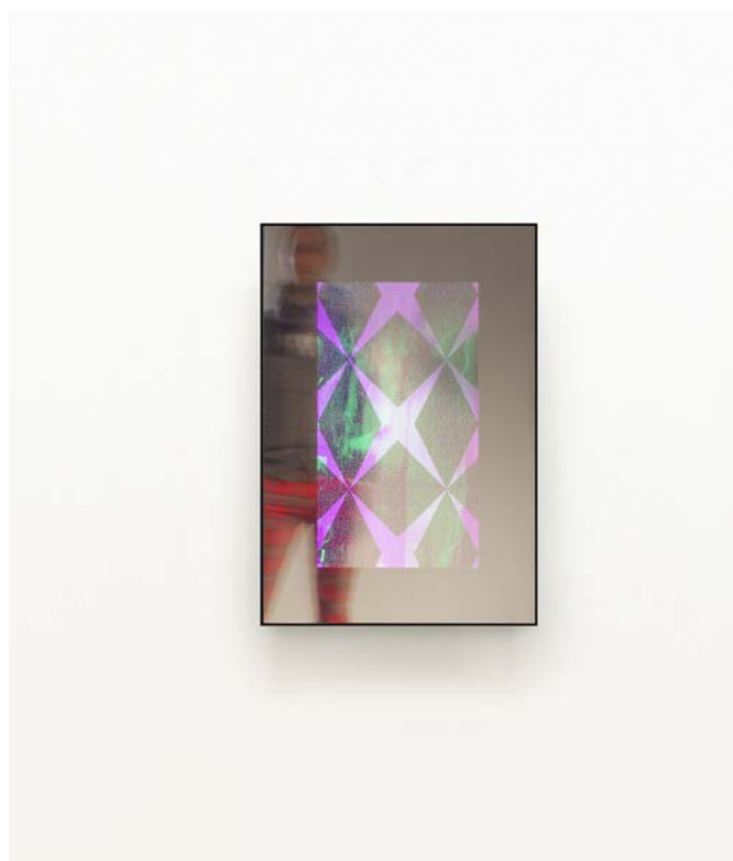
Vanity Star , miroir polarisé, feutre glitter, webcam, écran lcd et software / polarised mirror, glitter felt, webcam, lcd screen, software, 60 x 40 cm, 2012