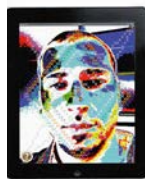
Vincenzo Marsiglia, Introsive Star , 2011, applicazione per iPad

Vincenzo Marsiglia, Only Star Future (particolare), 2011/2012