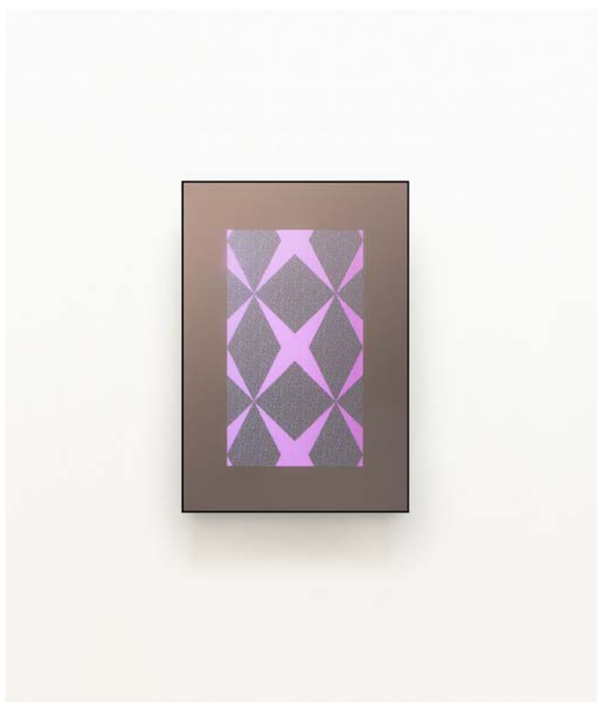
Vanity Star , miroir polarisé, feutre glitter, webcam, écran lcd et software / polarised mirror, glitter felt, webcam, lcd screen, software, 60 x 40 cm, 2012

Bac Art décoratif, Ecole d'Art d'Imperia (IT) Ecole des Beaux Arts de Brera (Milan, IT), spécialité Peinture