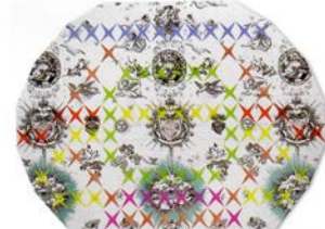
189 | ESPOARTE 77

MAI DIVERSE MOSTRE NEI PROSSIMI MESI, TERE FIA DICHIARATA, ARMONIA E CEGARONIA... Il prossimo mese saranno molto impegnati, il primo appuntamento importante è quello del 23 di giugno a Spoleto, a Palazzo Colonna: una personale con progetto site-specific,