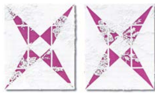
Vincenzo Marsiglia, Only Star Future , 2011/2012, vetro in vetro, 40x40x40 cm

Vincenzo Marsiglia, Form Star , 2010/2011, vetro in vetro, 40x40x40 cm