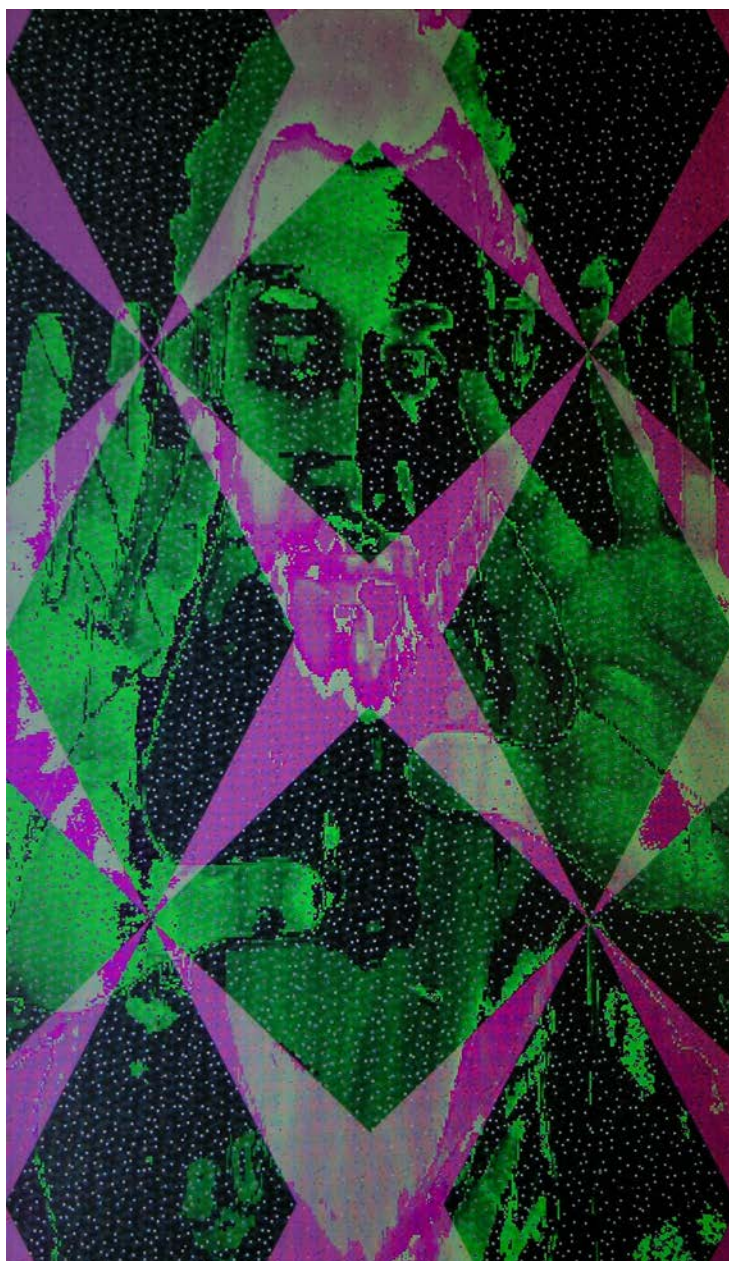
Vanity Star , miroir polarisé, feutre glitter, webcam, écran lcd et software I polarised mirror, glitter felt, webcam, lcd screen, software, 60 x 40 cm, 2012