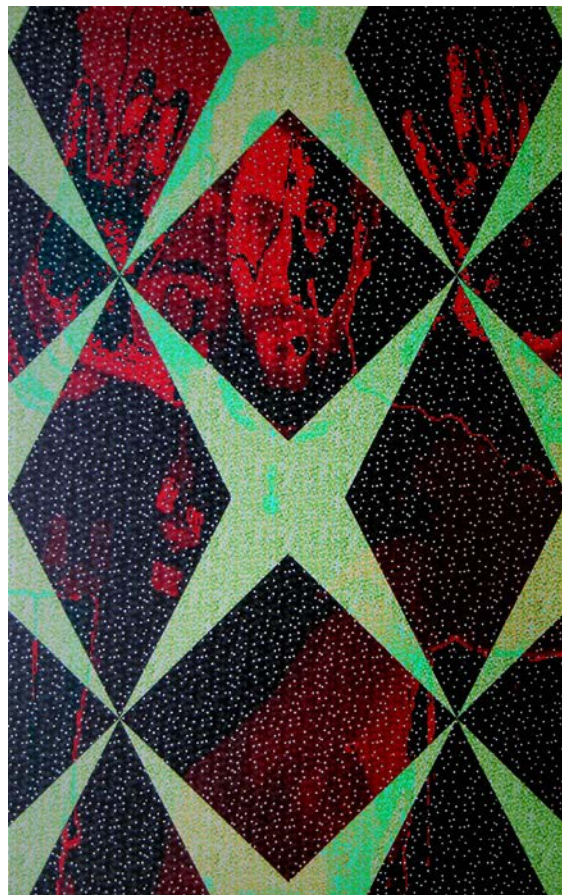
Vanity Star , miroir polarisé, feutre glitter, webcam, écran lcd et software / polarised mirror, glitter felt, webcam, lcd screen, software, 60 x 40 cm, 2012

Illusion ou réalité...confusion, désordre ou image contrôlée...? Les oeuvres de Vincenzo Marsiglia nous plongent dans ce sentiment interrogateur, «où se trouve la frontière entre l'espace réel et l'espace illusoire...?»