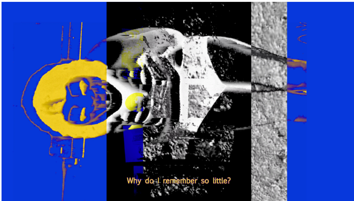
I don't remember much about her / redux MP4 - 325.4MB - 717 seconds 1920x1080px - Ed. 1/3 - 2022