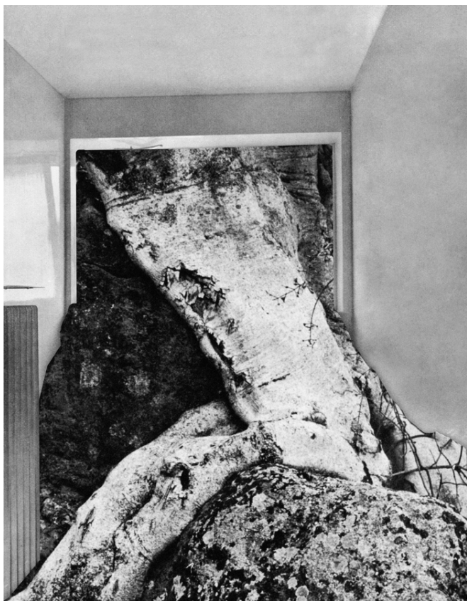
Yaël Burstein, Tree , 2007